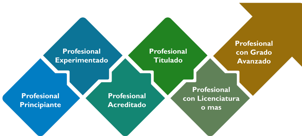
Figura 2: Conocimientos y Competencias Clave para los Proveedores de Desarrollo Profesional.